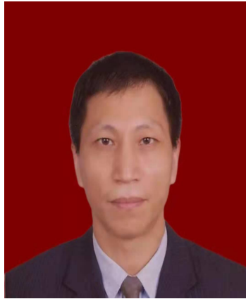
占启， ， 河北大学 属医 心 内